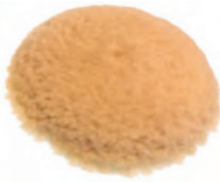
BUFF MAGIC PAD