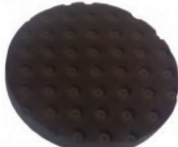
PRO POLISH PAD